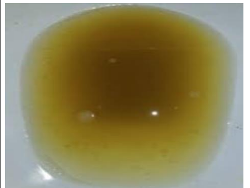
No está clara. Continúe. No se ve el fondo del inodoro.