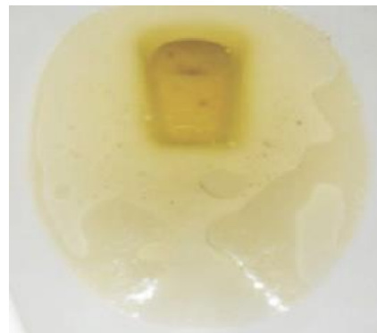
Buena preparación intestinal. Amarilla y clara

Si las deposiciones NO son de un líquido claro, antes de las 3 DE LA TARDE , (vea abajo, la foto de una buena preparación intestinal) LLAME al 858-966-4003 (opción 3) para hablar con la enfermera de gastroenterología.